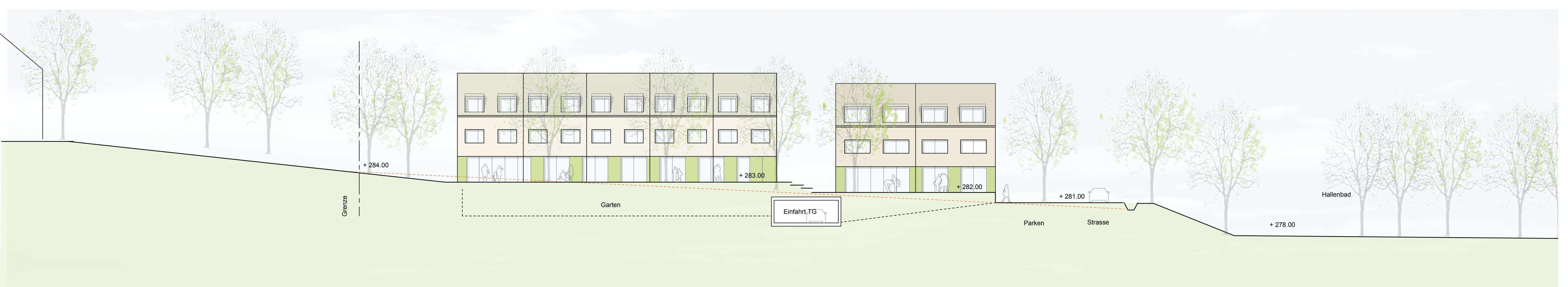
Ansicht Süden - Schnitt E-E M 1:200