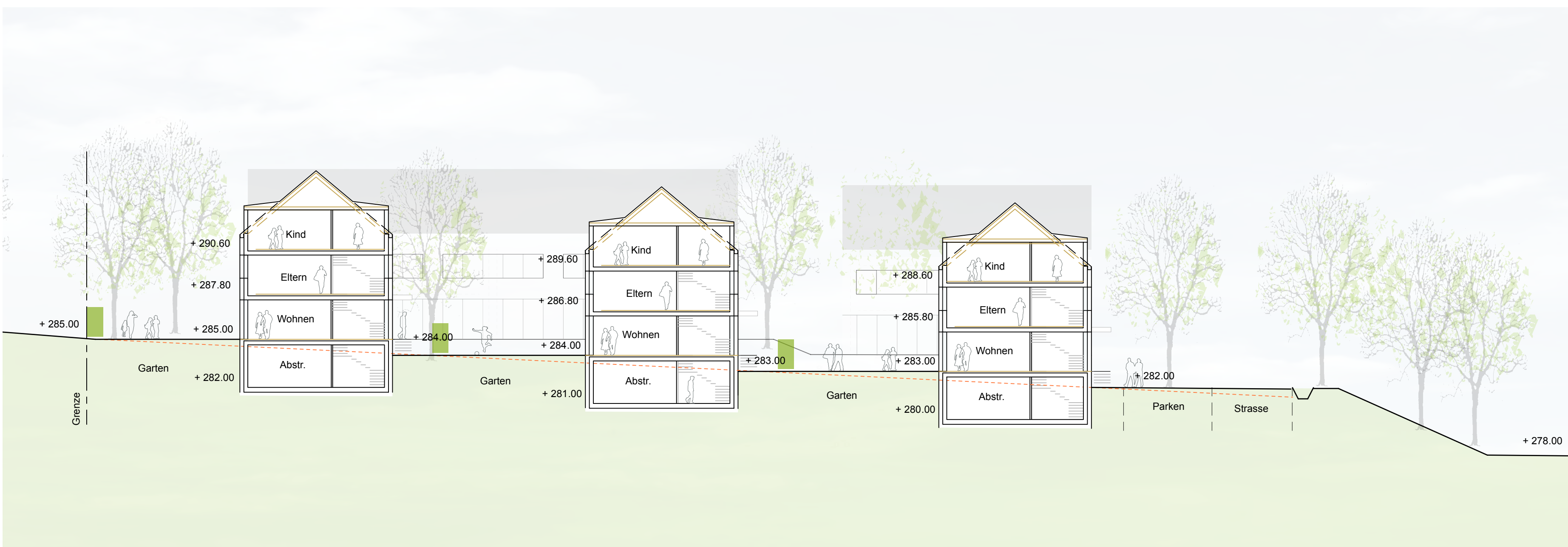
Schnitt B-B M 1:200