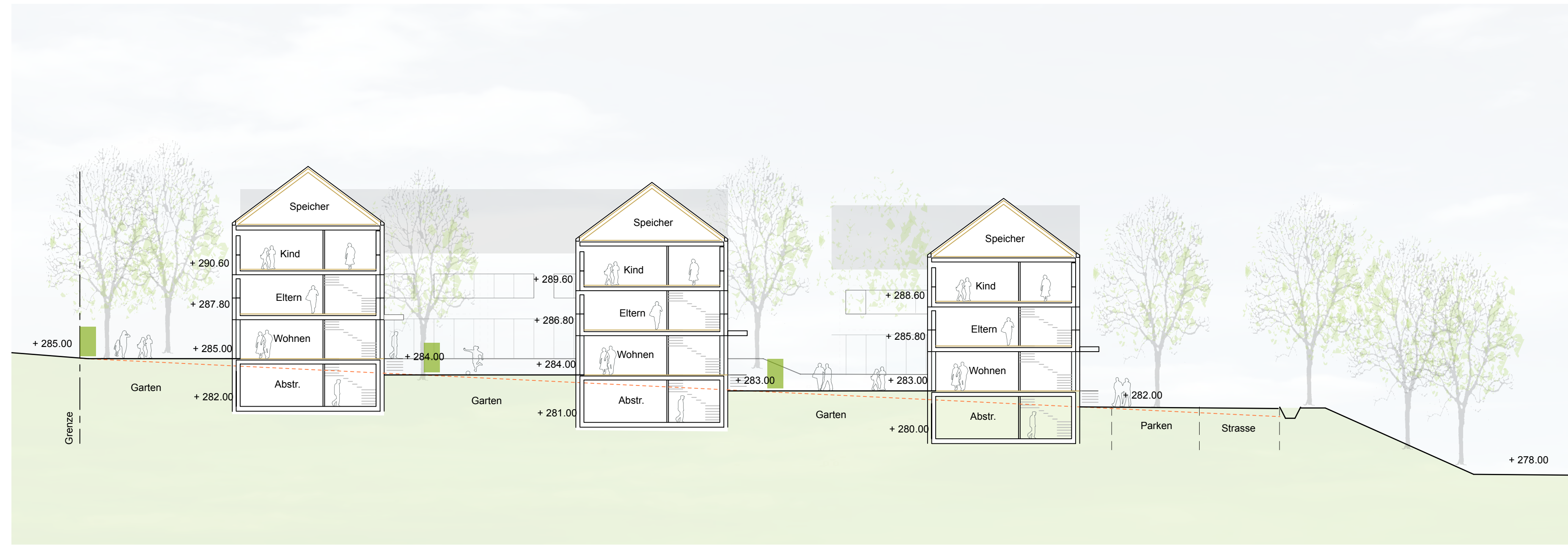
Schnitt B-B M 1:200