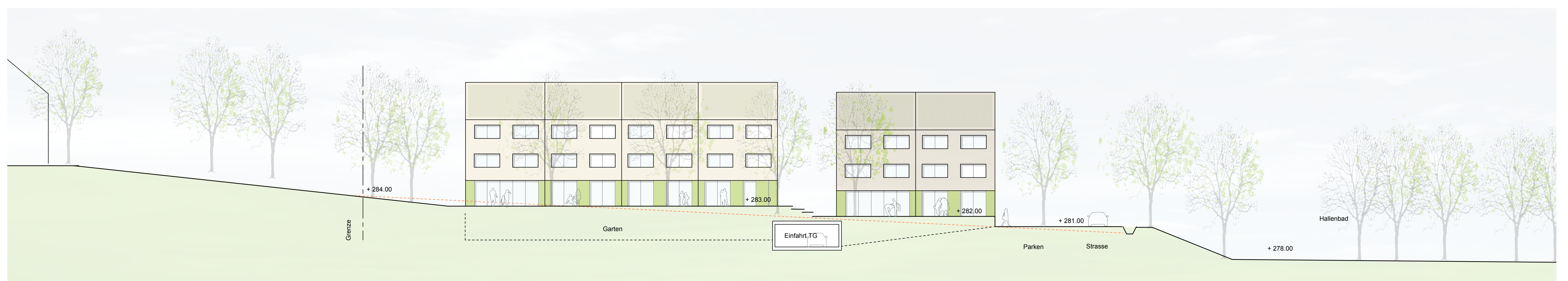
Ansicht Süden - Schnitt E-E M 1:200