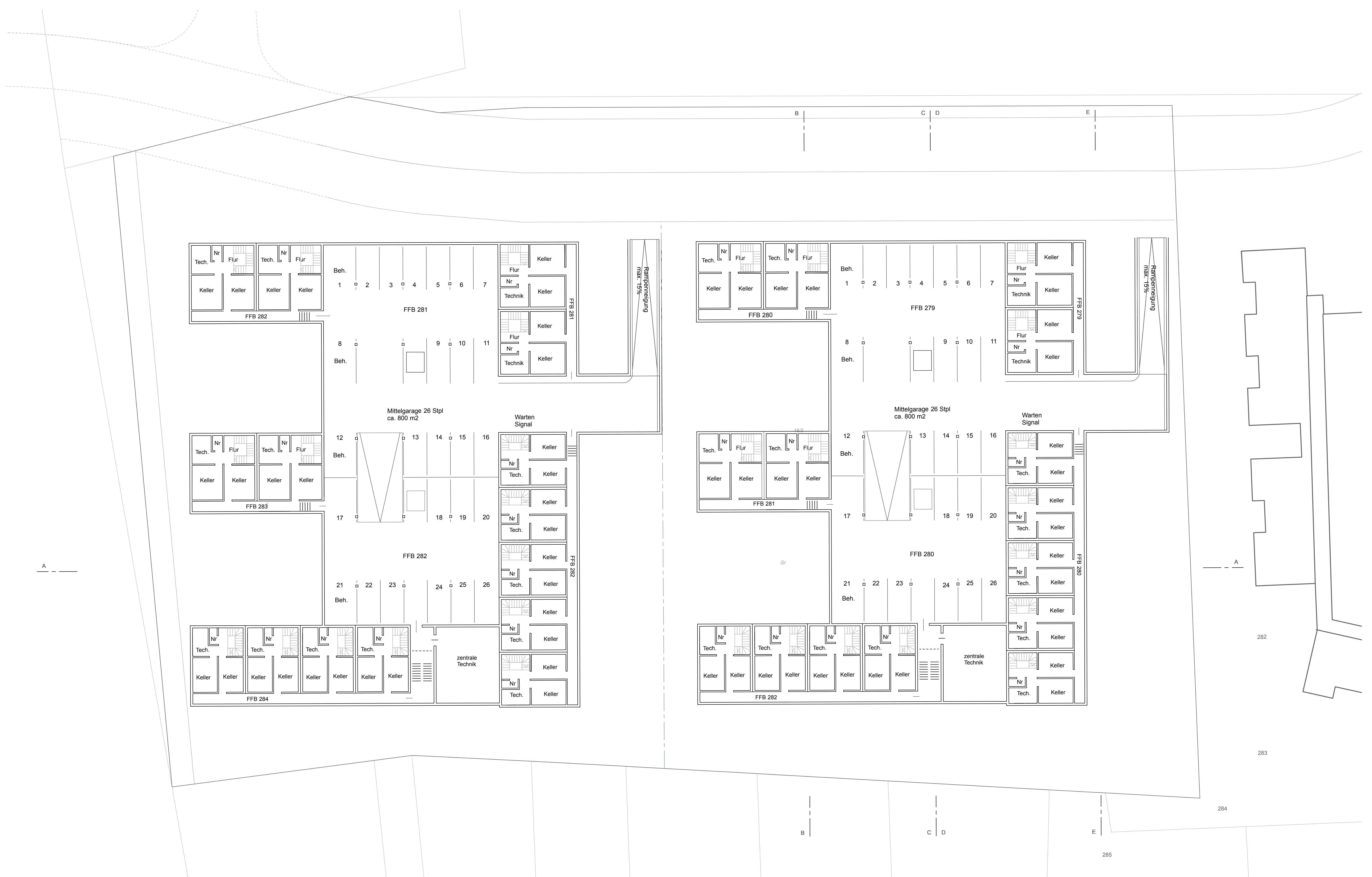
Untergeschoss M 1:200