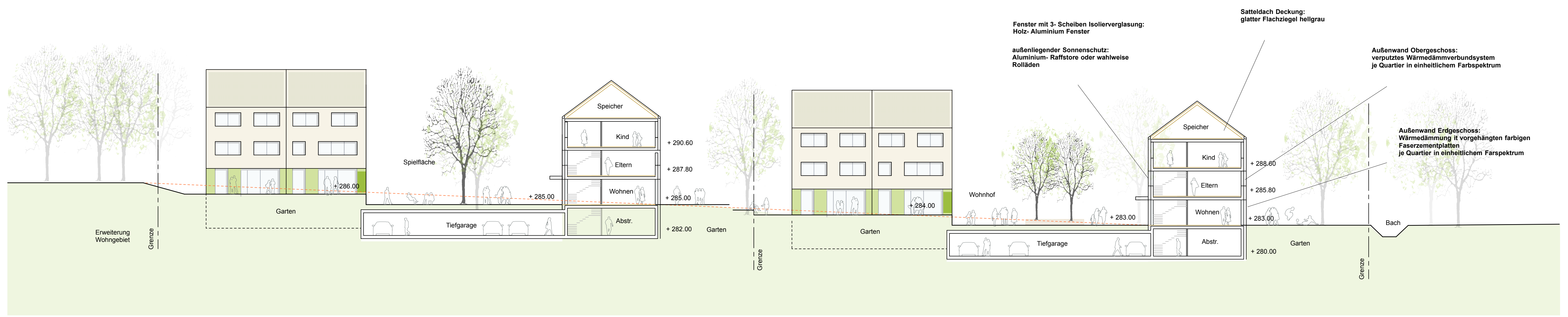
Ansicht Süden Schnitt A-A M 1:200 mit Angaben der Materialität der Bauteile

Überarbeitung Stand 10.07.17 - Variante 2- dreigeschossig + Satteldach