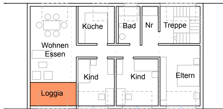
2. Obergeschoss Loggia/Negativbalkon ca. 4.00 x 2.00 m