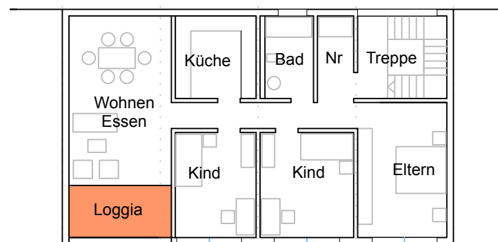
1. Obergeschoss Loggia ca. 4.00 x 2.00 m